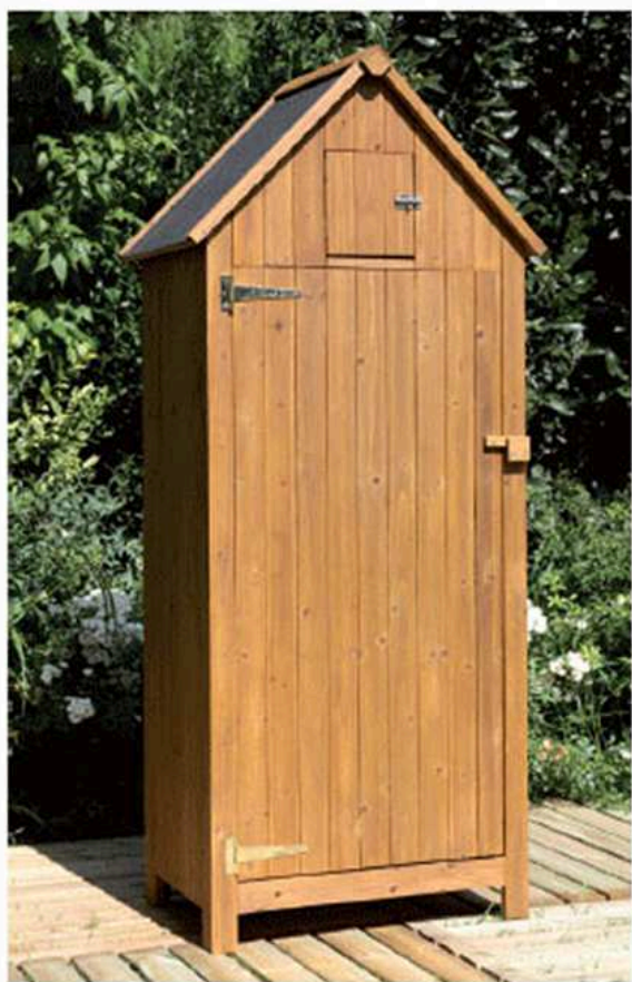
guaina già montata