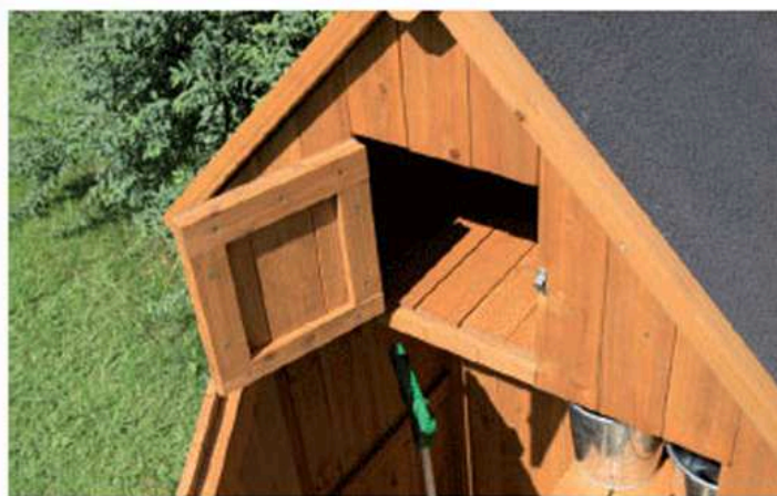
scomparto per piccoli oggetti