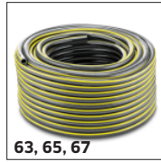
63, 65, 67