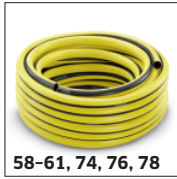
58-61, 74, 76, 78