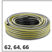
62, 64, 66