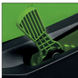
LEVA ALTEZZA TAGLIO CENTRALIZZATA