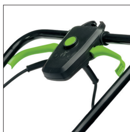
DOPPIA LEVA AVVIAMENTO